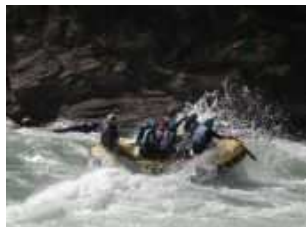
Rafting río Gállego